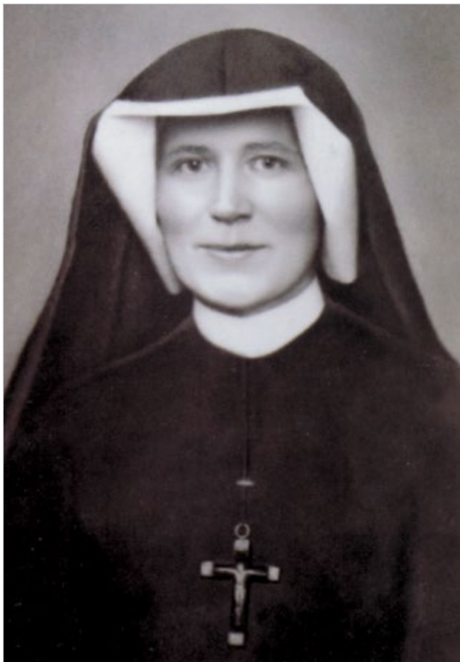
Svätá sestra Faustína (1905 - 1938)

V decembri 1936 hovorí Pán Ježiš po prvýkrát o novéne k Božiemu milosrdenstvu. Deväť dní, počnúc Veľkým piatkom, sa má sestra Faustína pripravovať na sviatok Božieho milosrdenstva ružencom, ktorý jej bol zjavený. Pán sľubuje: „ V tejto novéne udelím dušiam všetky milosti. “ (Denníček 796)